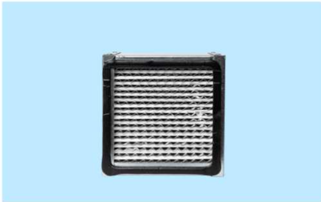
Elektrofilter Art. Nr.: WA7212LR zur Abscheidung von Staub- und Rauchpartikeln

der Deckenluftreiniger WA-2800 und WA-3600