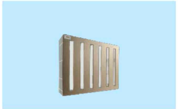
Aktivkohlefilter Art.Nr.: WA7213LR Bestehend aus 1x Vorfilter und 1x Aktivkohlefilter