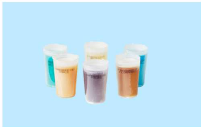
Duftpatronen Menthol Art. Nr.: WA7214LR